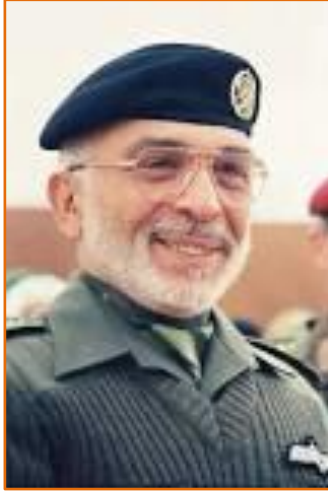
الملك الحسين بن طلال

الجماهيري الحكومة الإندونيسية بالسماح للفدائيين الفلسطينيين (وتحديداً حركة فتح) بافتتاح مكاتب لهم في إندونيسيا، والسماح للإندونيسيين المسلمين بإرسال متطوعين لتحرير الأقصى. ودعوا الحكومات الأجنبية إلى قطع جميع العلاقات مع "إسرائيل" لإجبار الصهاينة على "وقف أعمالهم الوحشية واللا إنسانية". 56