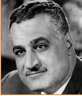
جمال عبد الناصر

لم يكن النظام المصري في ذلك الوقت قد تعافى بعد من هزيمته في حرب 1967 مع "إسرائيل"، وكان قد دخل في حرب استنزاف منذ ذلك الحين؛ لذلك اغتتم الرئيس المصري جمال عبد الناصر الفرصة لكسب الدعم والتضامن العربي والإسلامي. واعتبرت الحكومة المصرية حرق الأقصى جريمة تاريخية إسرائيلية، ونقطة تحول في أزمة الشرق الأوسط، وأن العدوان الإسرائيلي لم يكن ضد العرب فقط، بل ضد المسلمين في كل مكان. 41