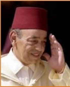
الملك الحسن الثاني

ليعرب عن قلق تونس من تداعيات تفجر مشاعر المسلمين من إندونيسيا إلى الرباط بسبب هذه الإساءة البغيضة للعالم الإسلامي. ودعت الحكومة التونسية السفراء إلى اتخاذ إجراءات عاجلة في حال أرادت "تفادي حدوث انفجار". 48 ومن المثير للاهتمام أن السفارة البريطانية لاحظت أنه بعد مضي أربعة أيام فقط على اندفاع الحماس والتأييد للجهة العربية الموحدة ضدّ الصهاينة، عادت الصحافة التونسية فعلياً لانتقاداتها المعتادة للزعماء العرب الآخرين، بالإضافة إلى إدانتها لدعوات الجهاد، واعتبارها دعوات خرقاء وغير مناسبة، وأنهم بذلك يخدمون الإسرائيليين! 49