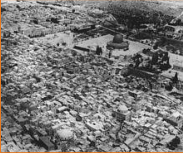
حارة المغاربة في القدس سنة 1900

بناء على القانون الدولي ومواثيق الأمم المتحدة، فإن شرقي القدس أرض محتلة من قبل "إسرائيل" بشكل غير قانوني، وليس من حق قوات الاحتلال أن تنتهك الحقوق والحريات المدنية لفلسطينيين