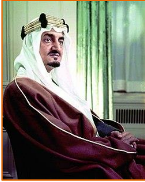
الملك فيصل بن عبد العزيز

حملت الصحافة السعودية "إسرائيل" المسؤولية عن حريق الأقصى. 44 ولاحظ أ. ج كريج A.J. Craig، رئيس البعثة الدبلوماسية في السفارة البريطانية في جدة، أن معظم الناس تقريباً يعتقدون